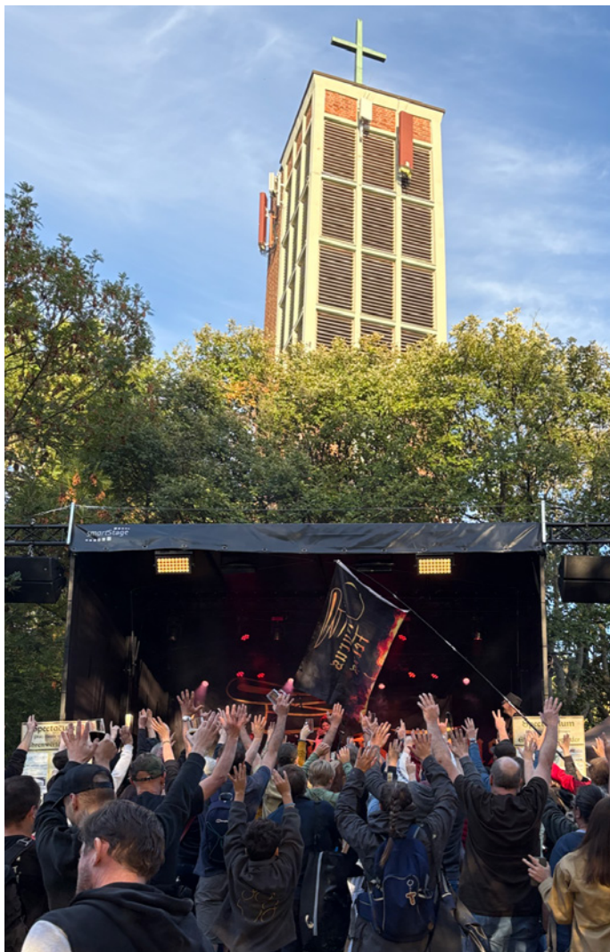
Beim „Spectaculum“ erinnern die Göttinger*innen an ihre Kaiserpfalz. Im Hintergrund der Turm der Friedenskirche.

Die Burg war groß. Sie lag gut geschützt zwischen den Flüssen und einem Wald. Ausgrabungen zeigen: Die Burg war ca. 16 mal 25 Meter groß. Das ist so groß wie fünf Reihenhäuser nebeneinander. Oder so lang wie ein großer LKW mit Anhänger, aber zehnmal so breit. Auf dem Hagen gibt es eine große Wiese mit alten