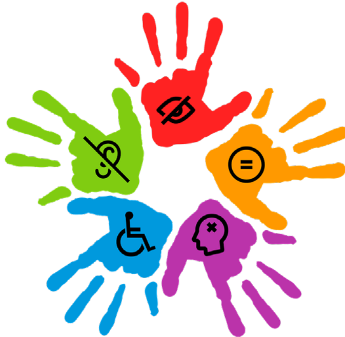
Abb.: Rosy / Bad Homburg / Germany auf Pixabay

Es gibt auch eine Bühne. Dort sprechen Menschen über die Probleme von Behinderten. Zum Beispiel geht es um