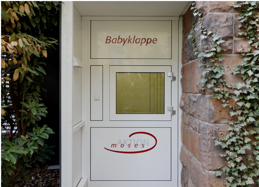
Baby-Klappe vom Marienkrankenhaus in Kassel